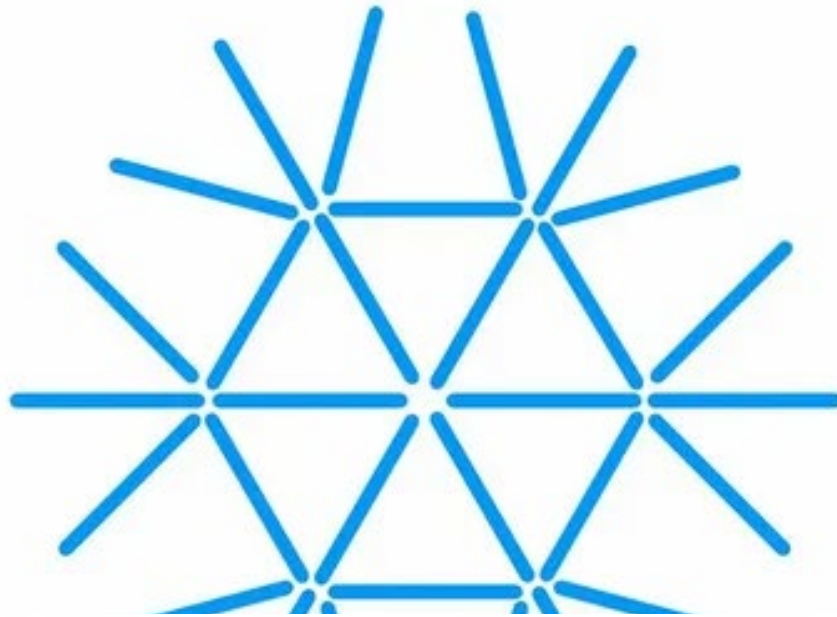
Схема для счетных палочек.